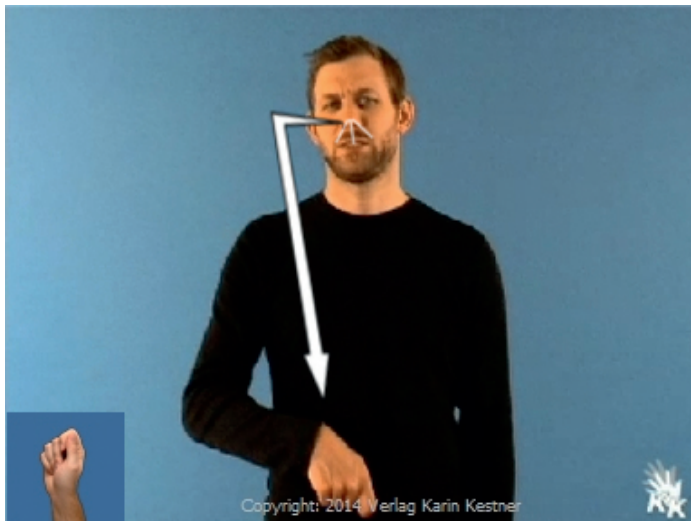
„Mist (dumm gelaufen)“